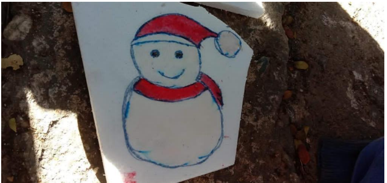
Ein Schneemann von Kindern gezeichnet, die Schnee nur aus Erzählungen kennen..