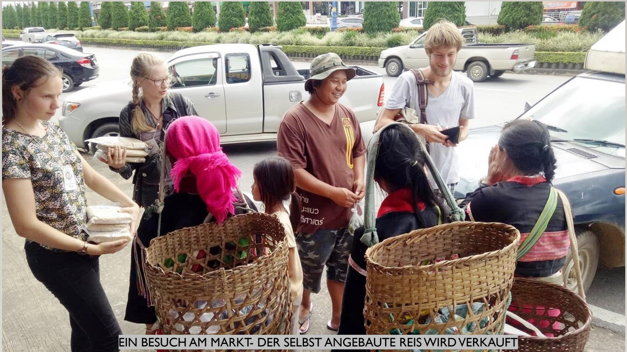
EIN BESUCH AM MARKT- DER SELBST ANGEBAUTE REIS WIRD VERKAUFT