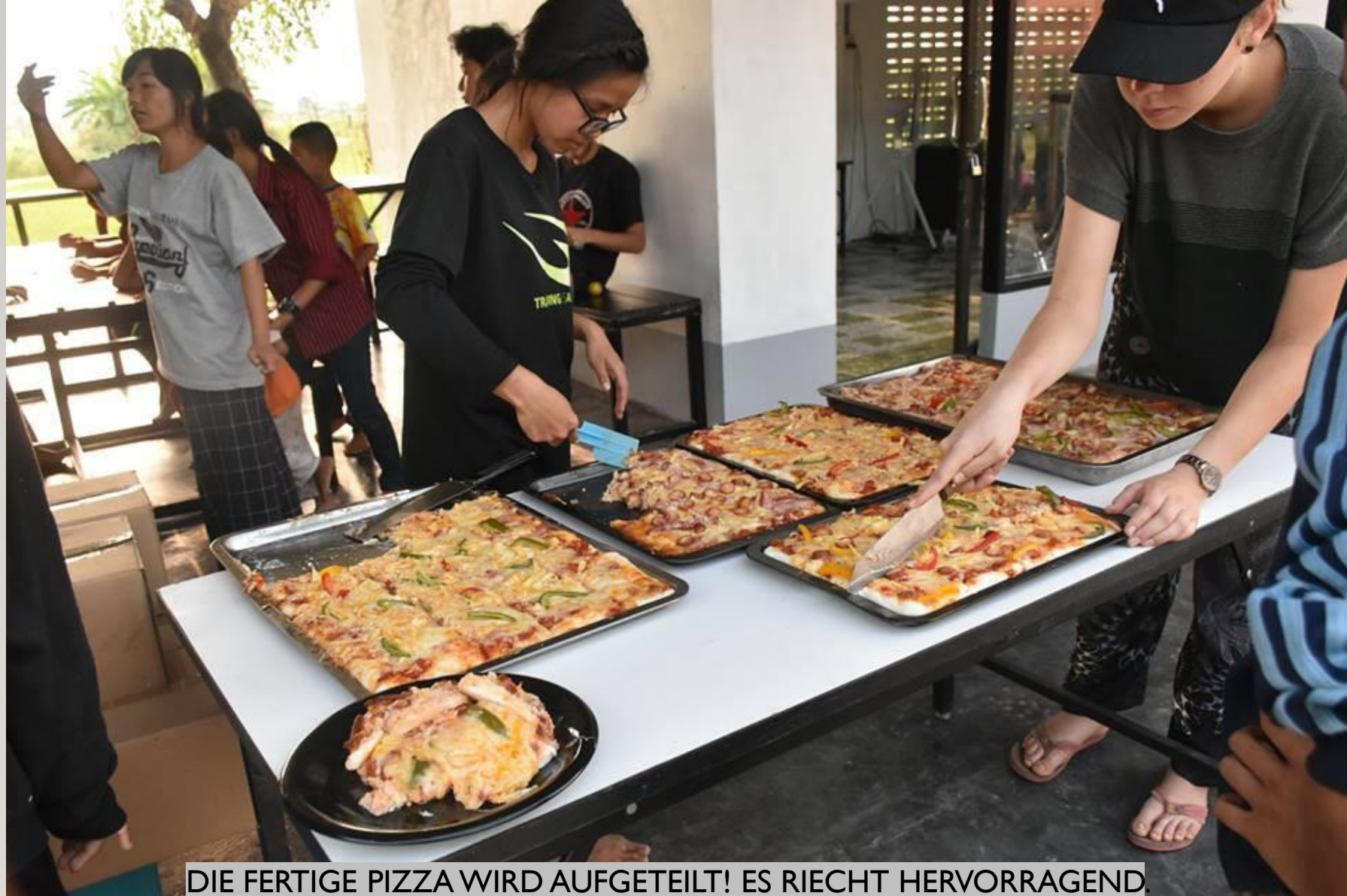
DIE FERTIGE PIZZA WIRD AUFGETEILT! ES RIECHT HERVORRAGEND.