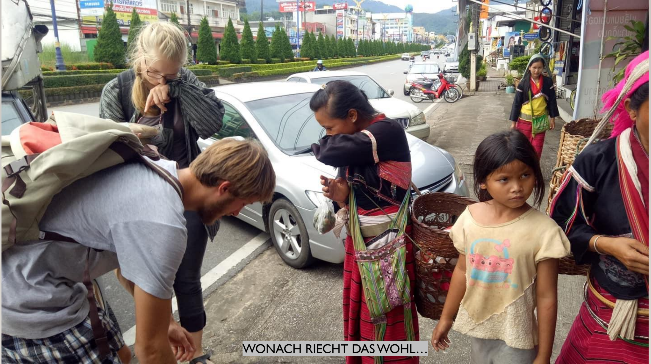
WONACH RIECHT DAS WOHL...