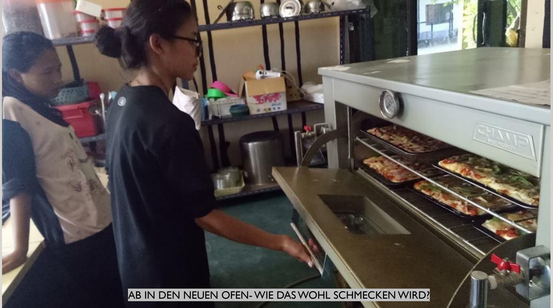
AB IN DEN NEUEN OFEN- WIE DAS WOHL SCHMECKEN WIRD?